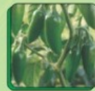
بلٹ ٹائیپ مرچ

سبزیات کے نئے آنے والے بہترین ہائبرڈ بیج