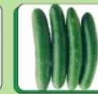
پارٹھیو کارپک کھیرا